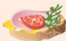
легкий бутерброд с отварным мясом