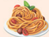
макароны или бобовые