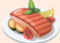
мясо или рыба