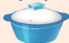
вареные или тушеные овощи